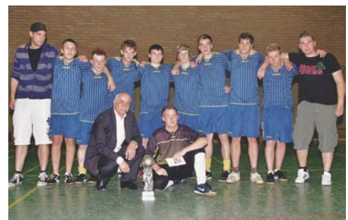
Die Turniersieger vom Jgz. „Waidmannsheil“

Bier und Wein: ab 16 Jahre, Bier und Wein in Anwesenheit einer personensorgeberechtigten Person (z. B. Eltern): ab 14 Jahre.